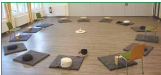
St. Josef Saal im Kath. Gemeindeheim Kupferdreh