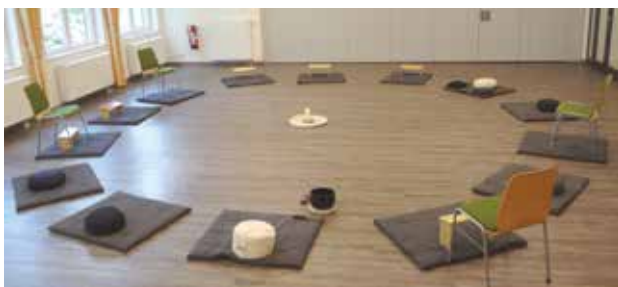
St. Josef Saal im Katholischen Gemeindeheim