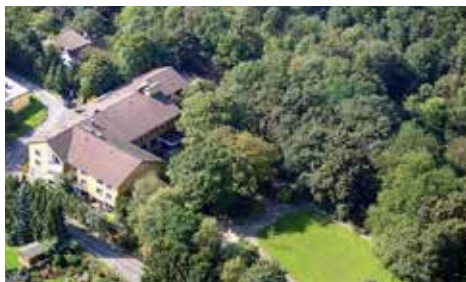
Haus am Turm

Leben für andere praktizieren wir im Alltag. Wir erhoffen uns neue Kraft aus der Stille und der Gemeinschaft für unser Dasein und Handeln für andere.