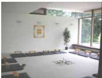
Haus der Stille Rengsdorf